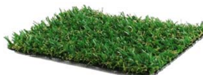
01 - Vert Prairie / Meadow Green

Disponible à la coupe (mini 8 m 2 ) Cut to size available (mini 8 m 2 )