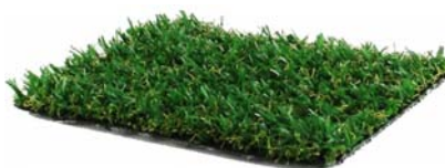
08 - Mix Vert et Marron Mix of Green & Brown

Disponible à la coupe (mini 8 m 2 ) Cut to size available (mini 8 m 2 )